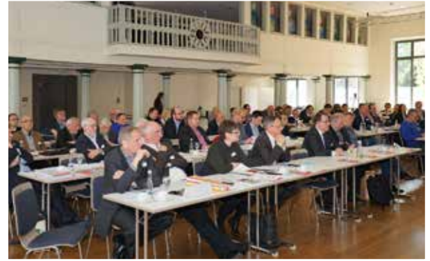
SGK-Landeskonferenz 2019, Schwäbisch Hall