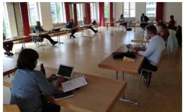
Landesvorstand mit Abstand, März 2021