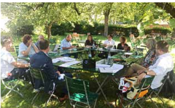
Landesvorstand im Freien, Juli 2021