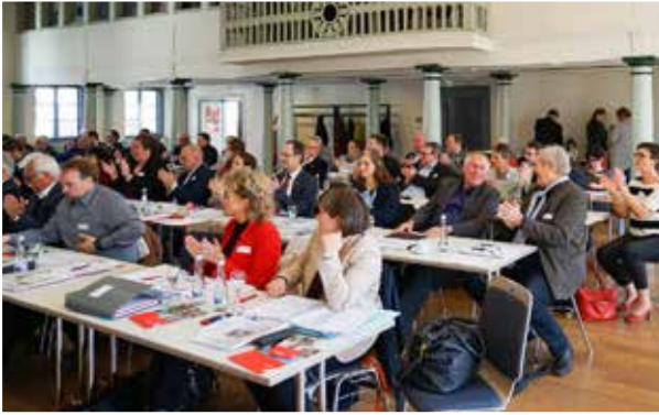
SGK-Landeskonferenz 2019, Schwäbisch Hall